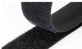
Tira de Velcro