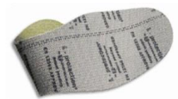
Plantilla anti-perforación flexible