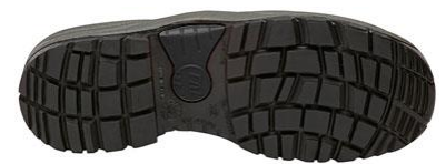
Suela Antiestática + Resistente a los hidrocarburos